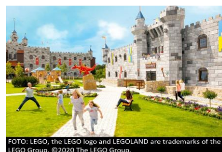
FOTO: LEGO, the LEGO logo and LEGOLAND are trademarks of the LEGO Group. ©2020 The LEGO Group.